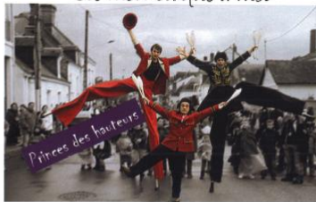
Cie mon cirque à moi